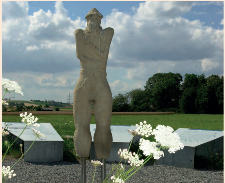
Keltische Grabstele beim Grabhügel

Vor 60 Jahren wurde die Figur bekanntlich gefunden. Und was haben die Menschen sich dann beim Anblick der Figur gedacht? Sie haben die bekannten und oben beschriebenen Vorurteile abgerufen: Kelte, kulturloser Barbare, Helm, bewaffnet: also „Krieger“. So wurde der „Hirschlander Krieger“ geboren und zur festen Begrifflichkeit.