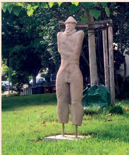
Vor Verwaltungsstelle Hirschlanden

Keltische Kunst und Kultur werden heute in vielen Museen gezeigt und als Zeugnisse einer Hochkultur gewürdigt. Auch in Ditzingen und Hirschlanden zeigt man stolz den „Hirschlander Krieger“. Das war nicht immer so. Noch vor sechzig Jahren, als in der Gemeinde Hirschlanden die großartige Figur gefunden wurde, galten die Kelten als ein kampferprobtes und barbarisches Volk, das mit merkwürdigen Riten von sich reden machte. Kelten galten als kulturlos und unzivilisiert. Warum war das so und warum hat sich das Bild von den Kelten als Kulturvolk in wenigen Jahrzehnten so radikal verändert?