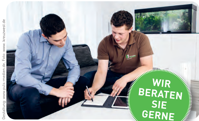
Gestaltung: www.puls-medien.de